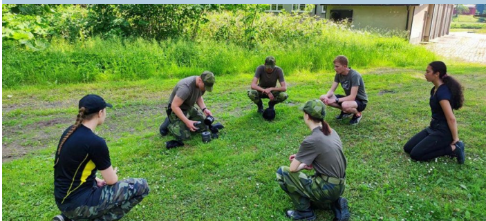
Utbildning i handhavande av soldatkök