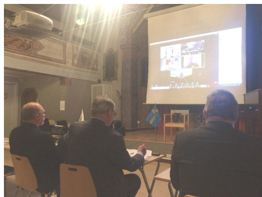
Sekretariatet kunde med lätthet följa såväl förbundsordföranden som stämmodeltagarna på bildskärm.

Tolv medlemmar deltog i olika centrala och regionala kurser. Av kategorin medlemsaktivitet kunde förbundsmästerskap i pistolskytte och Soldatprovet planerligt genomföras. Noteras särskilt stort deltagande på soldatprovet då 30 medlemmar ställde upp och genomförde fotmarsch om tre mil. Aktiviteter som inte kunnat genomföras har överförs till årets och kommande års verksamhetsplaner.