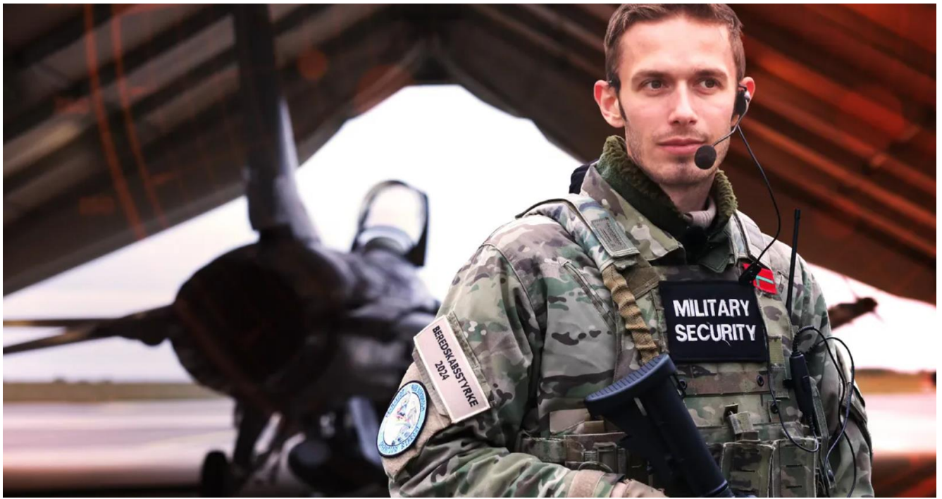
Lasse bevakar ett danskt F-16-plan.