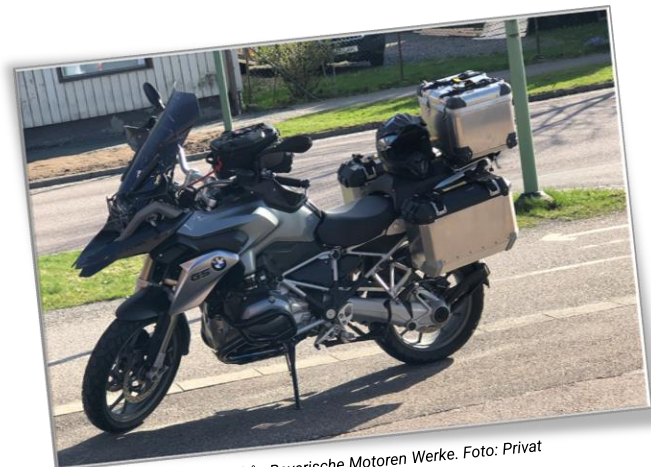
Bild: Paul kör en maskin från Bayerische Motoren Werke.