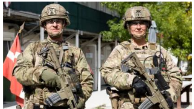
Danskt hemvärn på vakt i Kosovo. I och med Interflex har även Sverige numera hemvärnspersonal i internationell tjänst. Dock inte med stridsuppgifter som danskarna.

Som när Michaella och hennes skarpladdade kamrater i det marina hemvärnet tillsammans med dansk polis säkrar en hamn i samband med en viktig krigsmaterieltransport med slutdestination Ukraina ska lägga till.