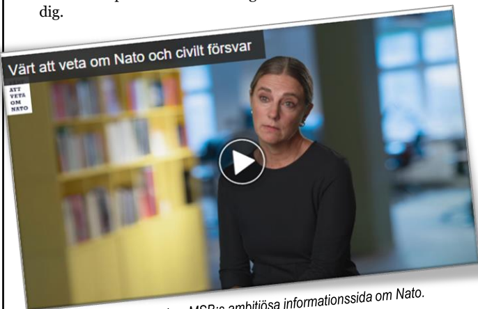
Skärmbild på del av MSB:s ambitiösa informationssida om Nato.

Där får du mer information om vad Nato är, vad medlemskapet innebär för Sverige och vad det innebär för dig.