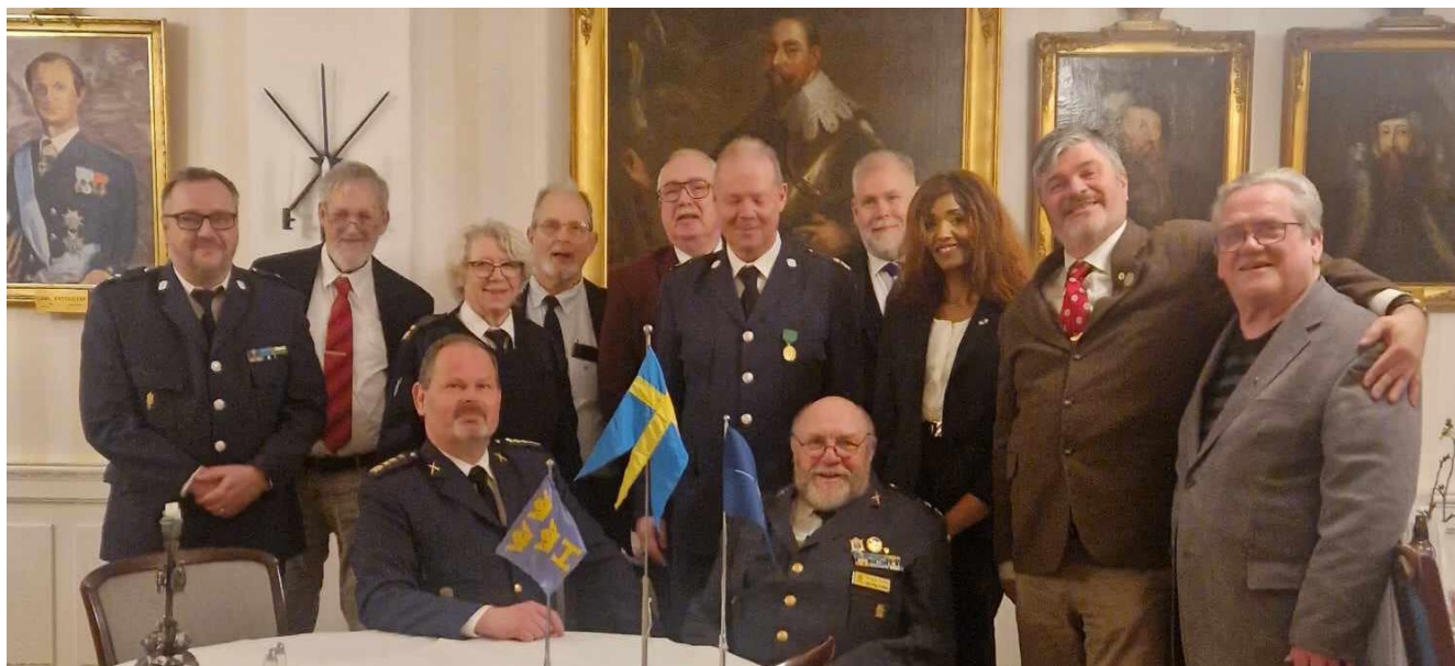
Delar av stämmodeltagarna framför porträttet av "Nordens lejon" – Gustaf II Adolf.