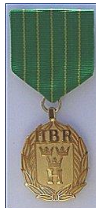
Petrimedaljen i brons till vänster. HBR Förtjänsttecken till höger.