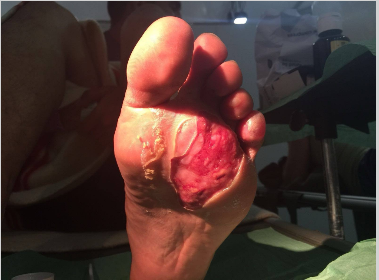
Foto från sjukvårdstält i Nijmegen

Bild från Nijmegen som visar vad som kan hända om man inte sköter om sina fötter.