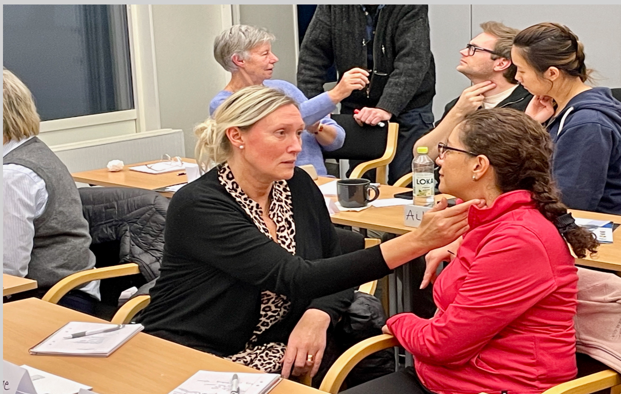
utbildning av regional sjukvårdstyrka Tylebäcks kursgård

Förutom statistiken ovan har vi genomfört ett antal regionaliserade kurser: Grundutbildning för frivilliga GU-F, Military weekend , Military weekend – ungdom, Civil beredskap grunder, Kombatant utbildning obeväpnad personal, För din säkerhet- kontaktperson och en Military day.