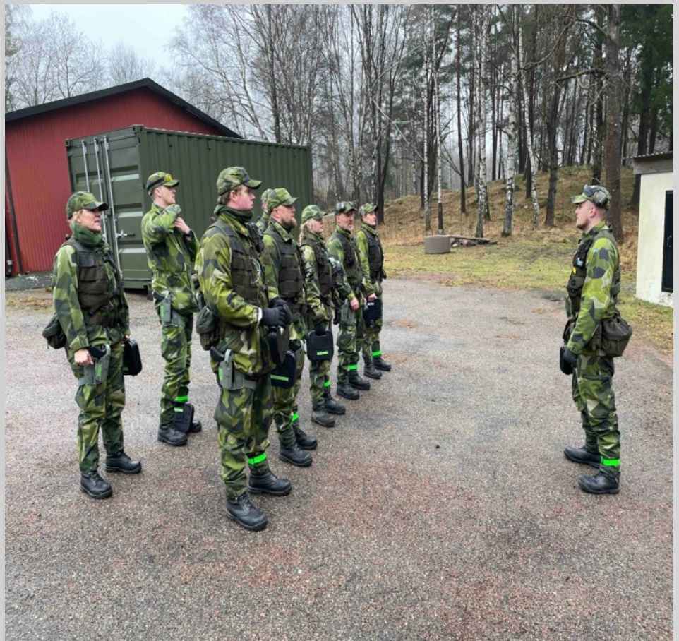
Garpland GU-F 2023 pistoltäten

Nyhetsbrevet innehåller; MRV,s lägebild om krigen som pågår. Information om två utredningar samt en text från KKrVA blogg.