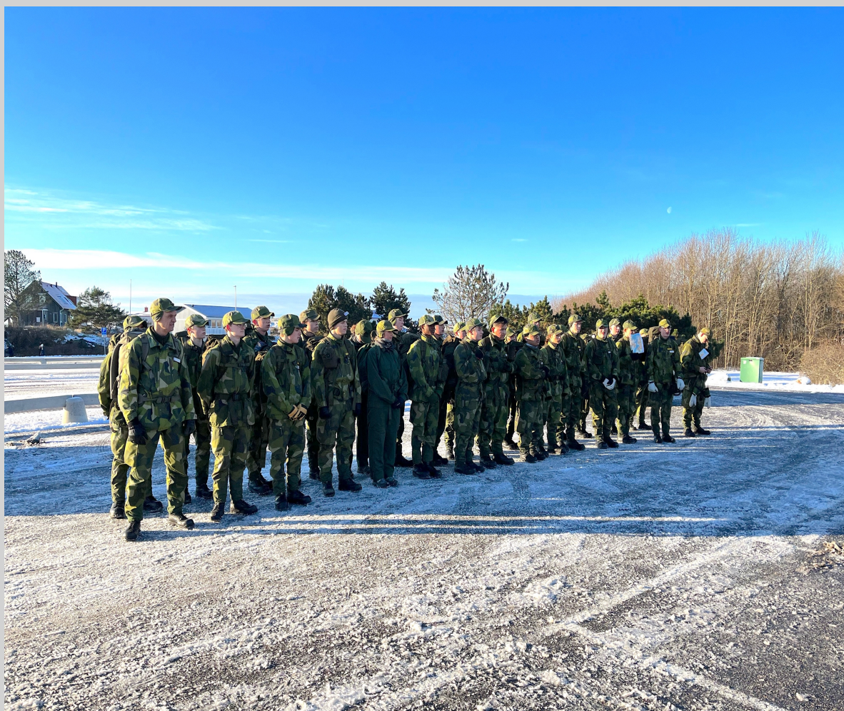
genomgång före marsch