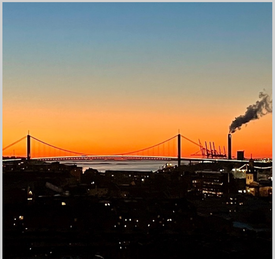
Foto: Älvsborgsbron i skymning