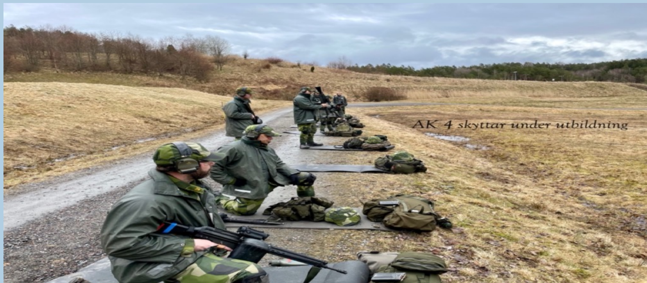
AK 4 skyttar under utbildning