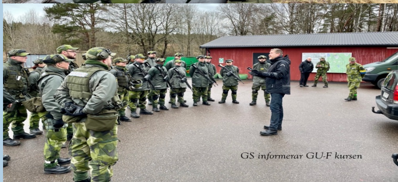
GS informerar GU-F kursen