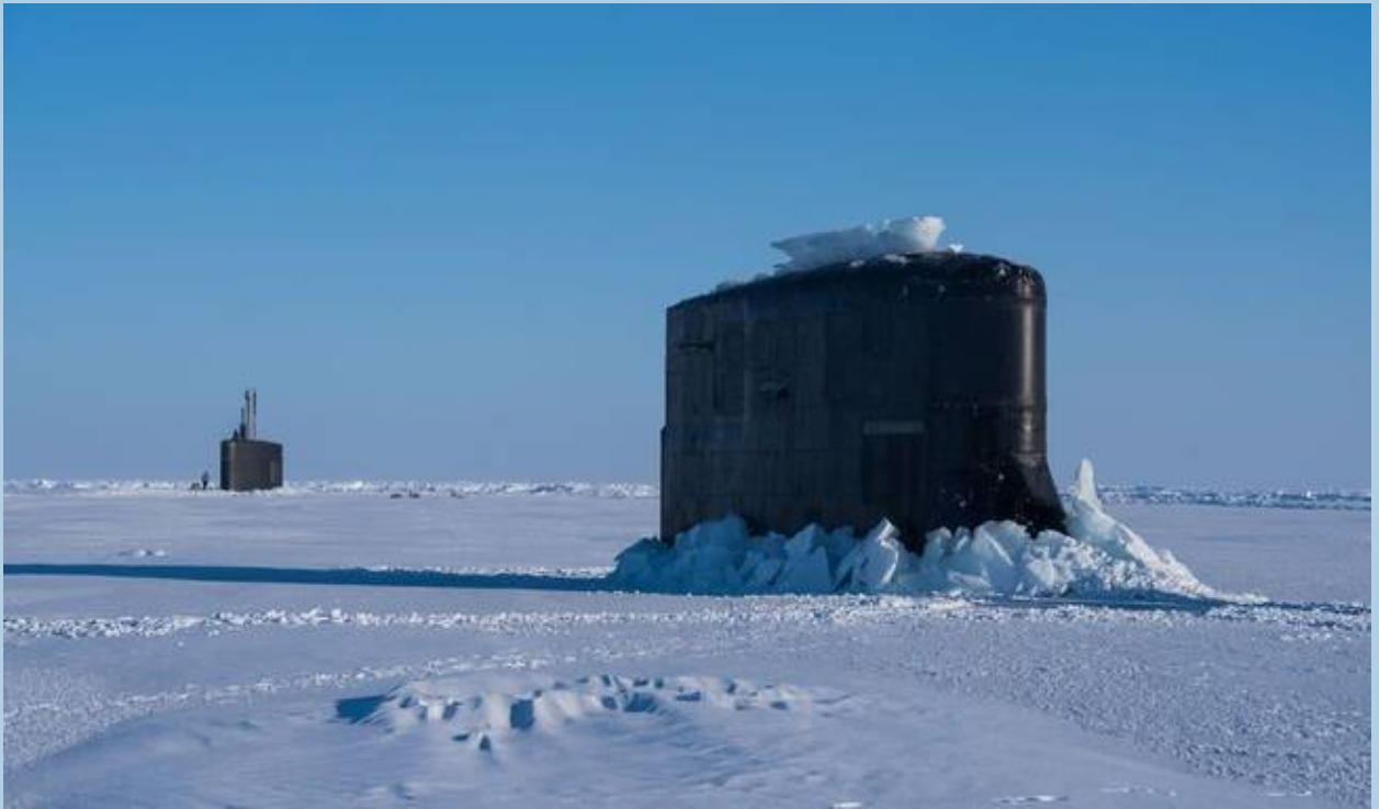
USA:s ubåtar USS Connecticut och USS Hartford har intagit ytläge genom isen i Arktis den 9 mars 2018.

– Vi ser en ökning i militär närvaro speciellt på den ryska sidan. Det började när Putin blev president andra omgången.