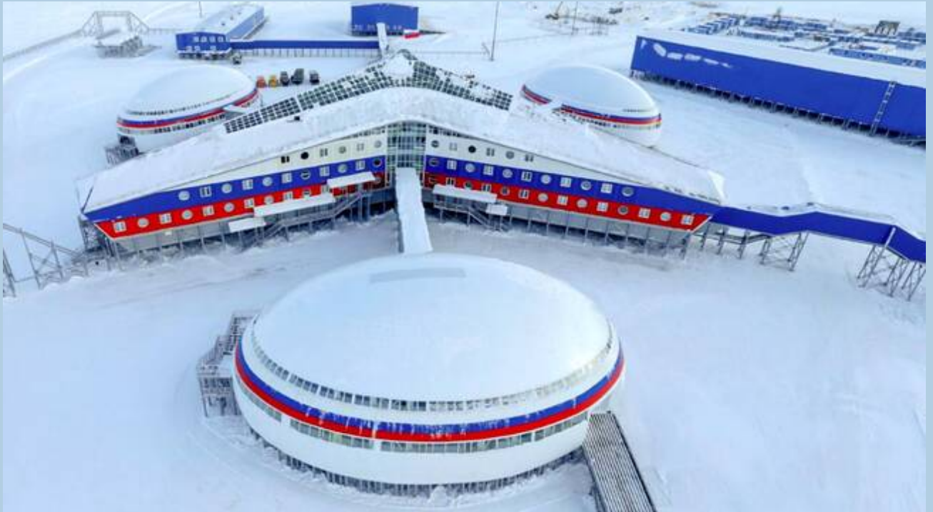
Ryska militärbasen Arktis treklöver.