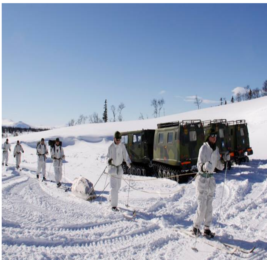
Under sportlovs veckorna 7,8,9 utbildar vi ungdomar i vintertjänst på Camp Ånn

Vi har också med en artikel från KKrVA som handlar om hemligheter. Vi uppmärksammar också Sankta Barbara som ju firas den 4 december.