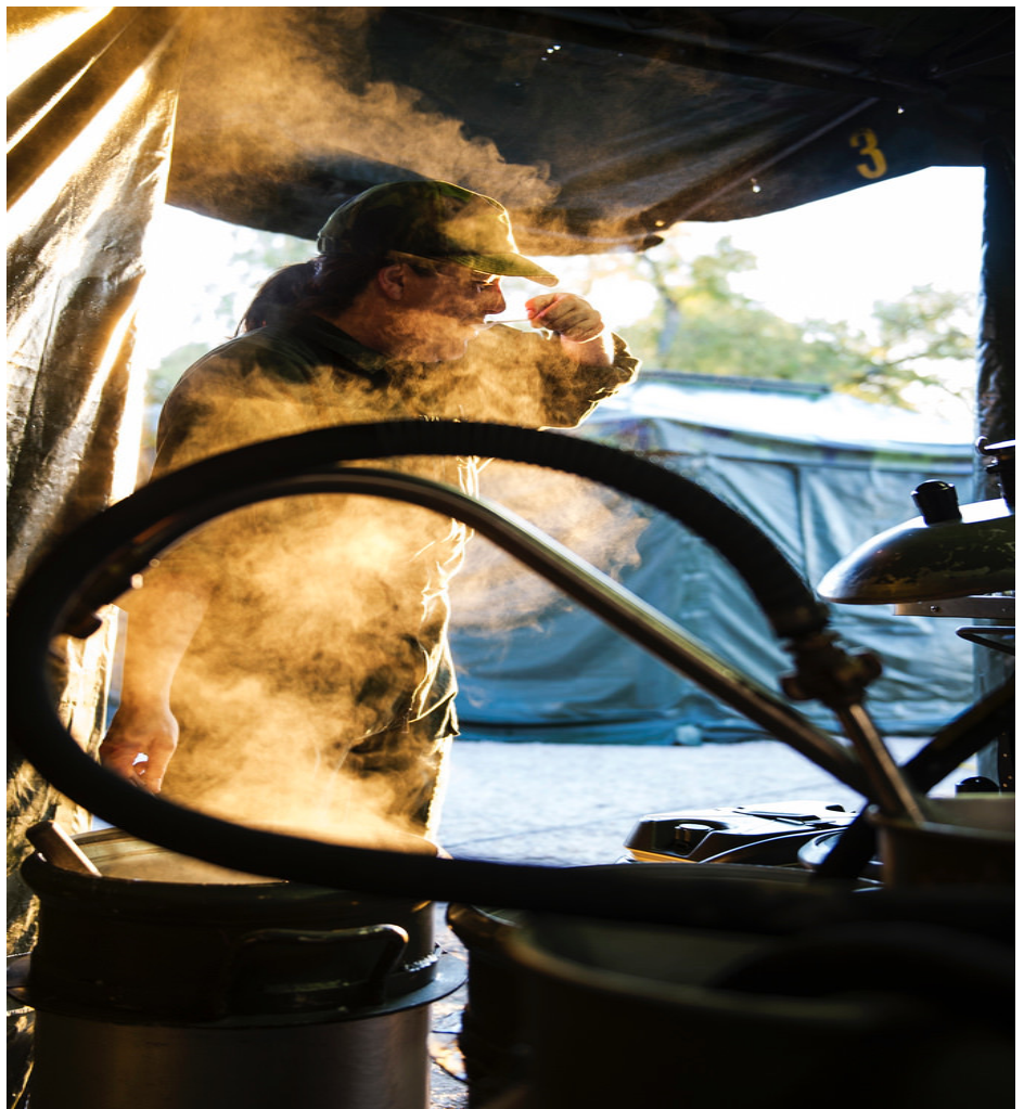
Försvarsutbildarna utbildar numera fältkockar till Hemvärnet

Hösten startade med ett (corona säkrat) event "För Din säkerhet!" på Kviberg. Följt av en helg med två kurser som gick samtidigt på Tylebäcks kursgård; fysiskt stridsvärde och en utbildning för de informatörer som ska introducera nya medlemmar i de frivilliga försvarsorganisationerna. Dessa två kurser flyttades p g a corona restriktioner på Göteborgs garnison. Ytterligare kurser kan komma att flyttas eller ställas in p g a dessa restriktioner.