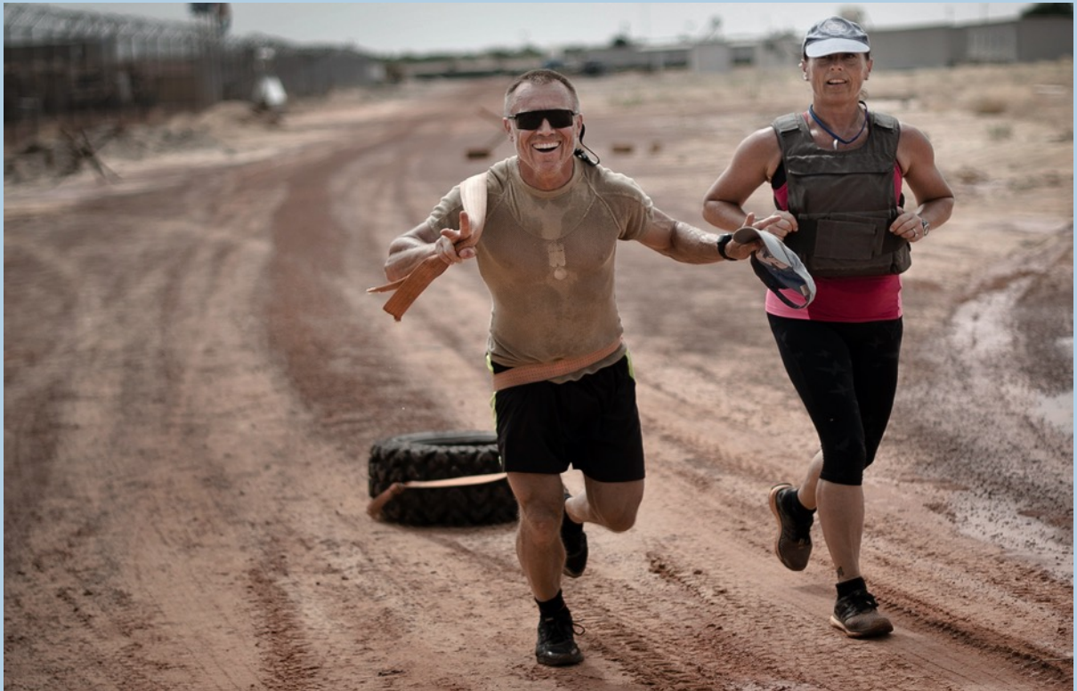
Fysisk träning med däck.

Målgrupp: Kursen vänder sig till all frivillig- och hemvärnspersonal som har en placering i insatsorganisationen. Den är även lämplig för instruktörer och funktionärer i frivilliga försvarsorganisationer, (exempelvis ungdomsledare).